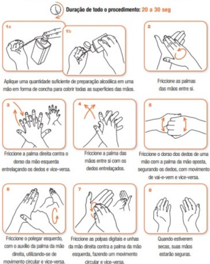
Figura 2 - Orientação sobre a correta higienização das mãos com preparações alcoólicas

Friccione as mãos com Preparações Alcoólicas! Higienize as mãos com água e sabonete apenas quando estiverem visivelmente sujas!