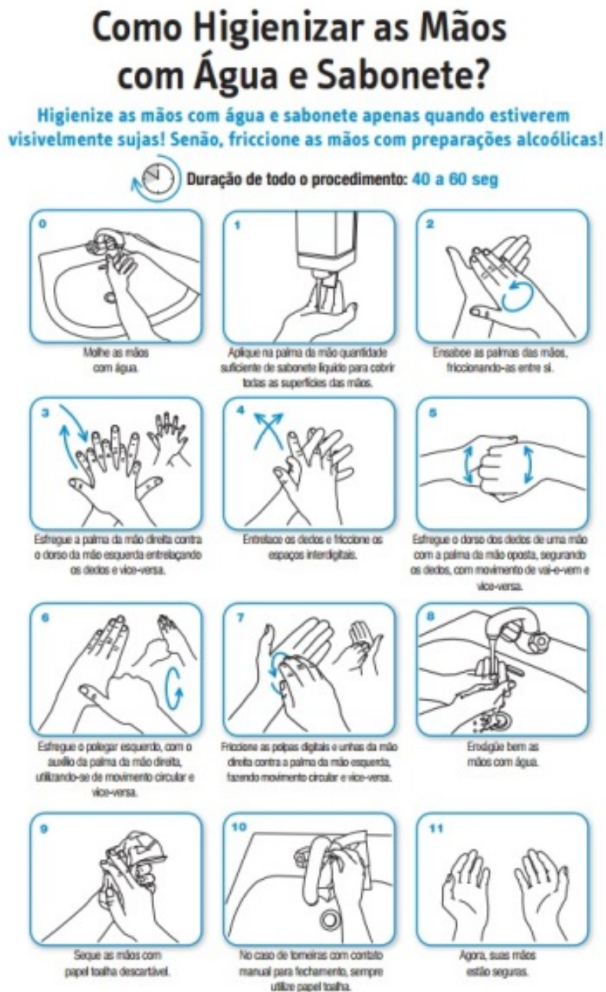
Figura 1 - Orientação sobre a correta higienização das mãos com água e sabonete

As orientações sobre a correta higienização das mãos, como uma medida básica de proteção e segurança estão apresentadas nas Figuras 1 e 2.